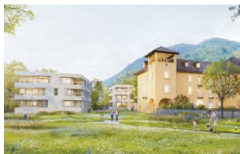
Giubiasco – Appartamenti