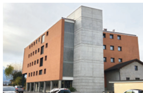
Giubiasco – Appartamenti