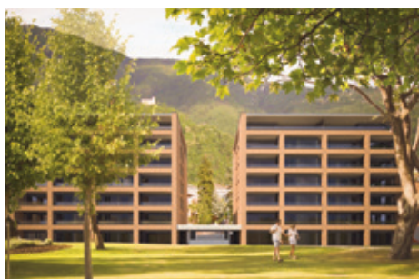
Bellinzona – Appartamenti